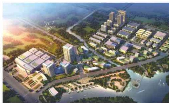
▲ 深圳科技工业园集团——湖州南太湖高新区科创园

内部红色圈，则代表服务赋能圈。产业中天立足11年产业运营的深耕优势，产业中天将智库学者、顶级律所、产业基金及专业服务机构等行业头部服务力量整合成链，共同构建到产业生态“热带雨林”，携手以产业链、业务链、科研链、金融链等全生命周期维度为着眼点，整合更多优质资源，为企业成长全链条服务赋能。