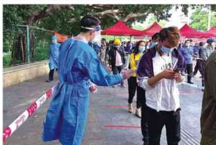
支援莞城东门广场核酸检测现场