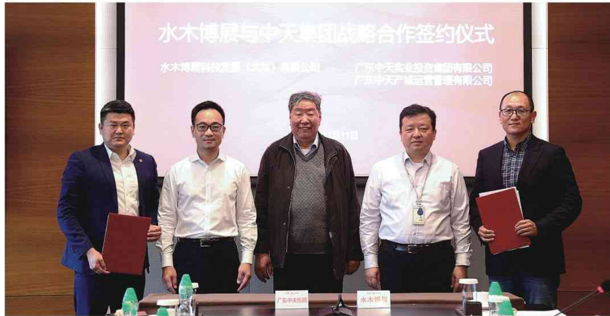
中天与水木博展合作签约仪式

现今，北京东莞企业商会的成立更是迎合了东莞市打开北京乃至全国发展窗口的迫切需要，为东莞企业与外界扩大联系提供了重要的平台。未来，中天集团将秉承北京莞企商会“团结、诚信、服务、发展”的宗旨，协助商会在北京与东莞两地之间的良好发展，为北京和东莞两市的经济发展、文化建设、人才交流贡献一份力量。