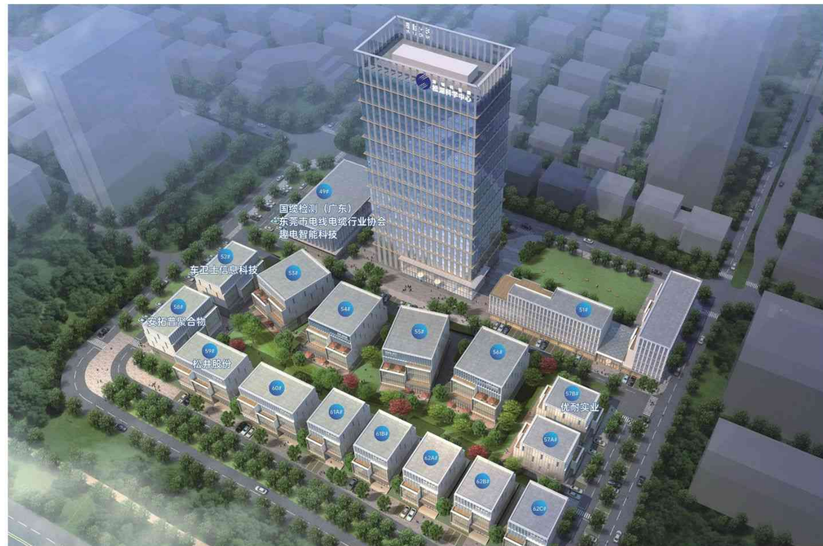
▲ 中天集团——国际金融园