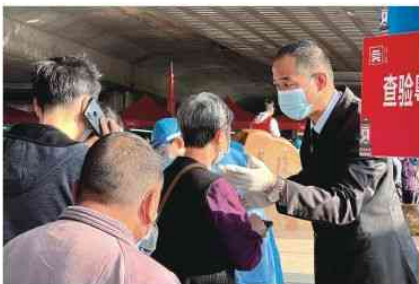
支援莞城博厦社区核酸检测点