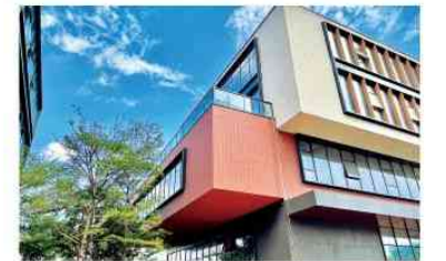
▲联科二期总部基地在建新品企业独栋

随着入驻企业的集聚发展，作为创新活力的成长摇篮，联科也在不断成长。目前，园区已经吸引了280多家总部企业入驻、2000多名高新人才在此为梦想奋斗，如世界500强巴西JBS集团、全球最大注塑设备供应商威猛巴顿菲尔、国际高端运动服饰品牌煌敏国际、亿元规模以上企业百兑通科技、跨境电商行业领先者斯达领科等。