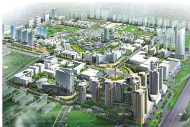
▲深圳科技工业园集团——深圳南山科技园