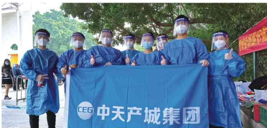
支援莞城东门广场核酸检测点