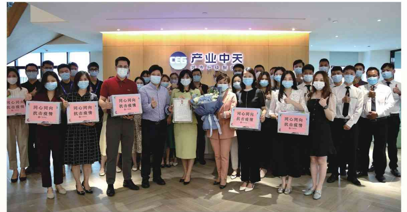
2021年6月22日 集团领导慰问各抗疫单位员工