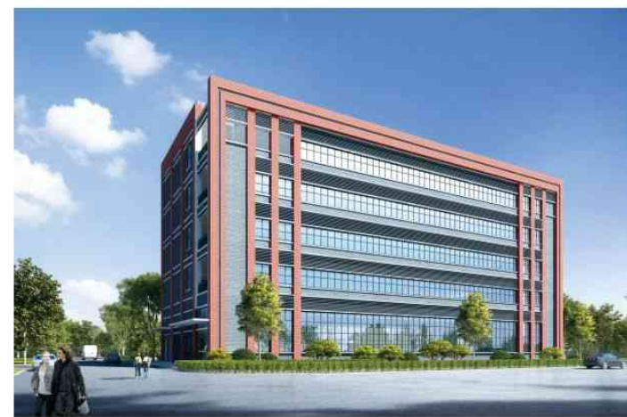
▲ 中天·联科滨海智造港独栋厂房产品效果图