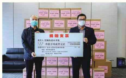
2020年3月6日 向莞城街道办事处捐赠

3月17日，集团给中山大学附属第一医院捐赠了价值154000元的防疫物资，包括防护服300件，KN95口罩5000个。