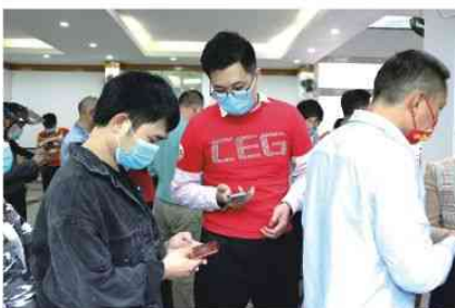
支援东城乌石岗核酸检测现场