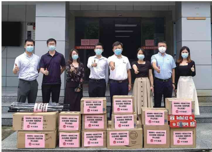
2021年6月23日 慰问横坑社区