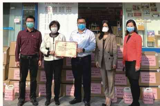
2020年2月25日 向南城街道慈善基金捐赠