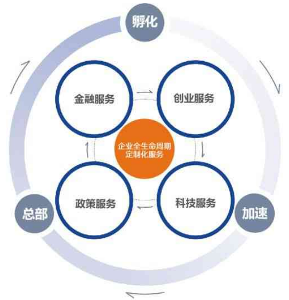
▲ 产业中天运营服务体系

此外，联科还与多家知名高校、行业协会、产业机构达成战略合作，通过科技服务、金融服务、人才服务等为企业提供全生命周期定制化服务，提供超过3亿元金融服务、助力企业获得1800万元政策补贴、成功申报2000多项知识产权及资质认定，助力园区企业加速发展。