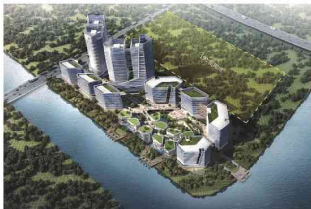
▲深圳科技工业园集团——中山翠亨新区产业园