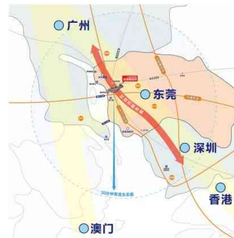
▲ 中天·联科滨海智造港区域交通图

产品形态也经过多轮设计才定稿，最终采取国际学院风建筑风格，提高企业形象，让企业有面子。同时在内部空间设计上把生产区放在中心，辅助功能区分在两端，达到空间利用率最大化。价值最高的首层做到7.2米层高，可建桁车，空间利用率极高。