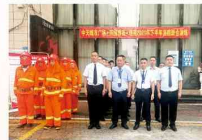
城市广场、南国雅苑、锦苑