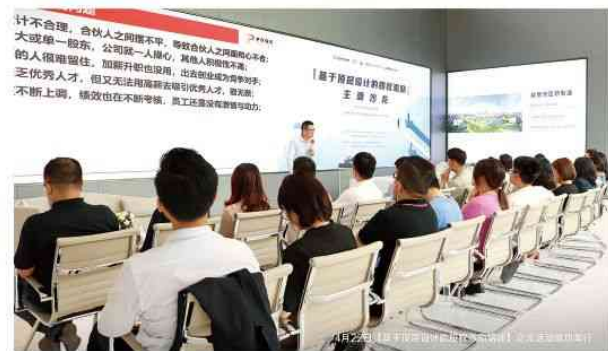
▲ 产业中天聘请专家给企业做管理培训

针对这一问题，园区利用中天集团自身的物业运营团队和酒店配套等资源，为园区企业配置了“天企VIP日”服务，不仅能安排保安和公共物料在企业现场营造仪式感，还能提前准备好有意义的礼物，规划好高体验的接待、餐饮、娱乐一条龙方案，帮老板节省心力和开支，让企业有面子。