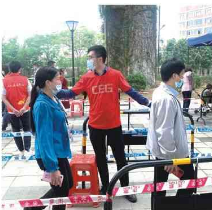
支援长安新民核酸检测点

疫情就是命令，防控就是责任。作为一家从东莞成长起来的民营企业，我们同样有责任支持政府做好疫情防控这一当前头等大事。15日凌晨，集团向全体同事发出号召：全速行动起来，踊跃投身所属区域疫情防控一线，助力属地政府防止疫情扩散蔓延。