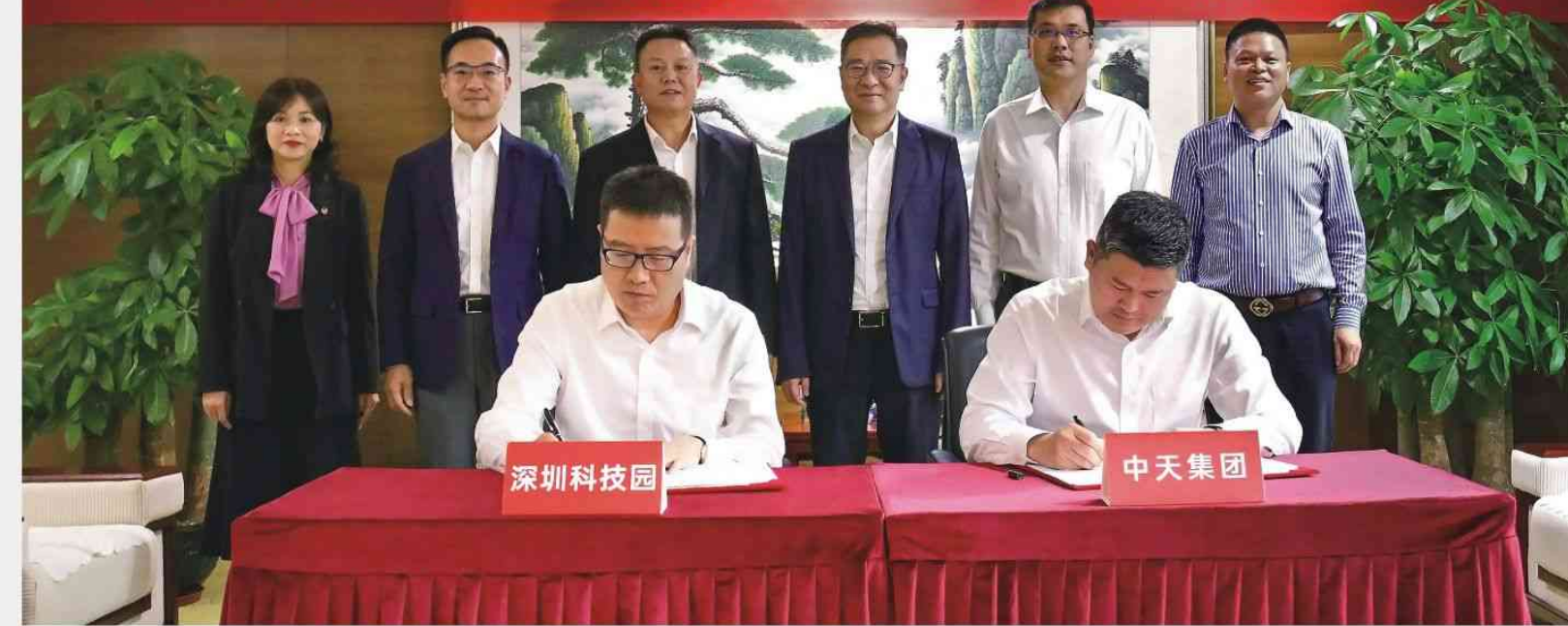
▲深圳科技工业园集团与广东中天集团战略合作签约仪式现场

2021年，东莞在确保地区生产总值高质量稳定过万亿元并接续推进高质量发展，向建设更高水平的新一线城市挺进这一进程中，面对存量经济与新技术革命并进的态势，东莞全力打造多元发展、多极支撑的现代化产业新体系，以吸引更多的战略新兴产业企业与高层次人才，为高质量发展注入源源不断、强劲澎湃的新动能。