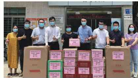
2021年6月23日 慰问新民社区