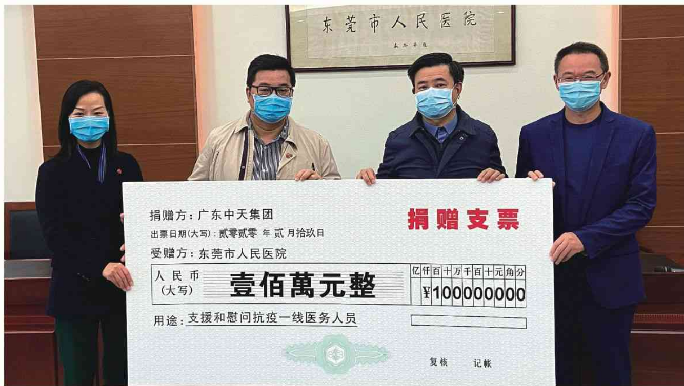
2020年2月 防疫慰问人民医院捐赠100万元