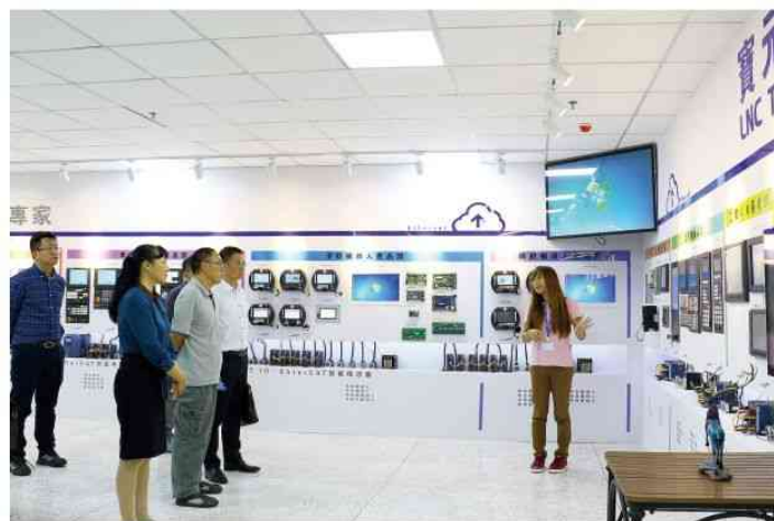
▲ 联科组织广科师生走进宝元数控进行校企交流

随着近年来联科周边交通利好不断，园区环境和氛围日益提升，使得企业品牌形象持续强化，不但在业务拓展方面大步迈进，对于公司吸纳人才也有所帮助，不少传统企业也因此将总部、研发中心、电子商务中心落户于联科，吸引更多高端人才的加入。