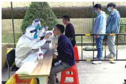
支援雅泰新村核酸检测点