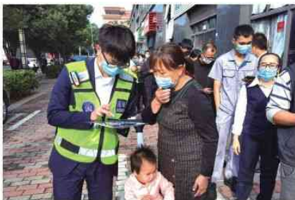
支援城市之门核酸检测现场