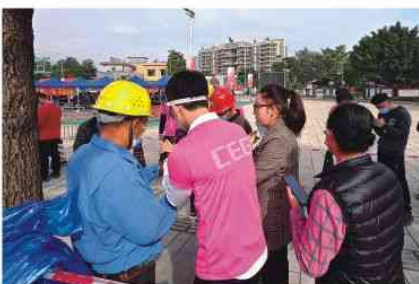
支援南城蛤地社区核酸检测点