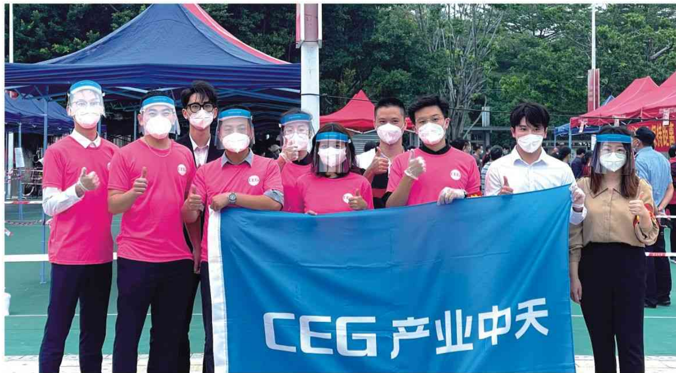
支援南城蛤地社区核酸检测点

近日，东莞市疫情形势严峻。为保证人民群众身体健康和生命安全，东莞市于12月15日启动全市全员核酸检测工作，并组织全市党员、干部支援疫情防控一线。