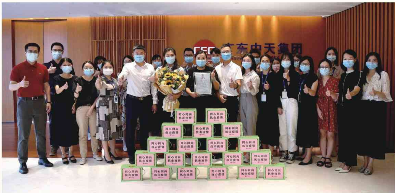
2021年6月22日 集团领导慰问各抗疫单位员工