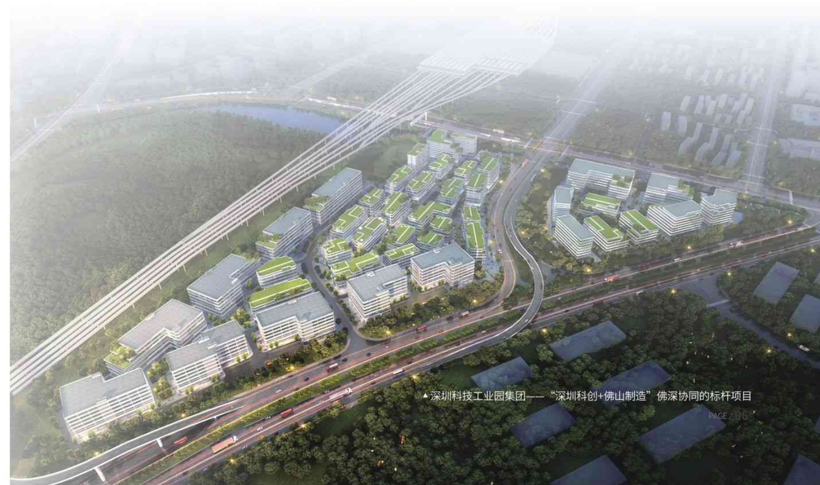
▲深圳科技工业园集团——“深圳科创+佛山制造”佛深协同的标杆项目

随着粤港澳大湾区战略的深化推进，城市群融合发展、大湾区协同向前成为每一个湾区城市的课题。东莞作为重要节点城市，迎来“双区”和横琴、前海两个合作区建设以及新技术、新产业、新业态蓬勃发展的重大机遇。着力打造湾区创新高地，先进制造之都，抢抓战略性新兴产业蓬勃发展新风口，推动“创新+产业”再上新台阶，成为东莞稳定增长、抢抓风口的最大底气。