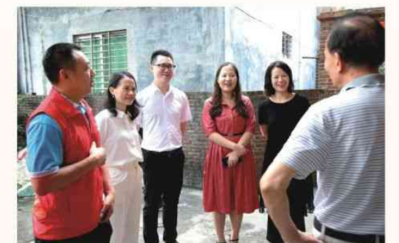
2021年9月8日 新基社区慰问