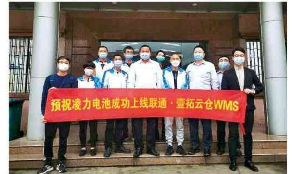
▲ 为凌力电池与联通链接自动化合作

联科运营团队经过走访了解企业经营情况及实际需求后，为凌力电池对接联科5G生态战略合作伙伴中国联通，提供WMS（仓储管理系统）服务，助力凌力仓储系统智能化升级，并协助申报云商平台奖补政策，节省人力成本及企业信息化支出，如今，凌力电池仓库作业效率大大提升，为其产能提升及智造升级奠定先进管理基础。