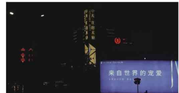
中天·江湾天地 精神堡垒夜晚亮灯效果

形美观等要求。比如，室内设计中要求的室内最小净高不能小于3米，这就需要机电专业进行管线综合排布来消除不利的安装因素，按照室内设计要求的净高进行管线安装控制；天花排布时，消防、空调等机电设施布置对天花造型可能存在影响，那就需要进行优化，从而达到一个整洁舒适的观感……。综上，所有细节都需在工程品质管控下才能体现出室内设计最好的效果。