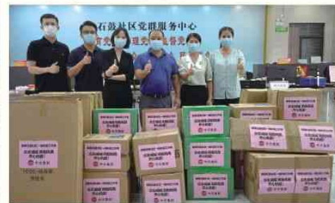
2021年6月23日 慰问石鼓社区