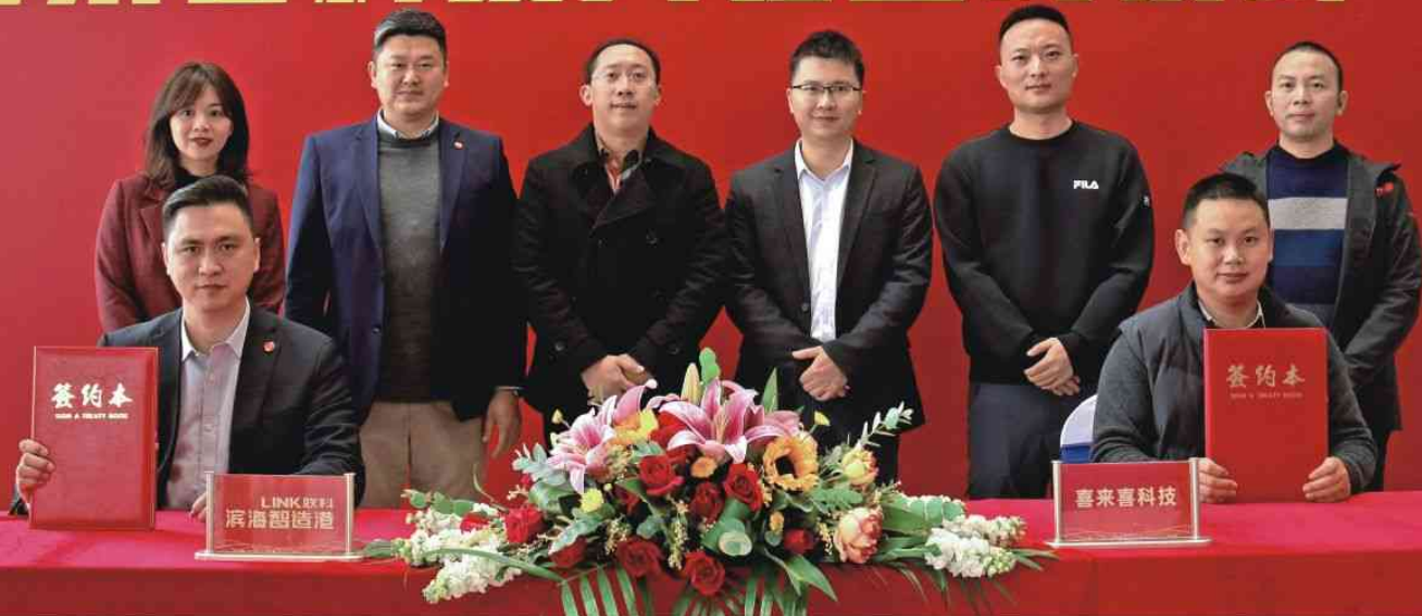
灵创计划启动后首家企业喜来喜科技入驻中天·联科滨海智造港