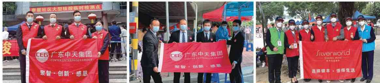
支援厚街寮厦社区核酸检测点