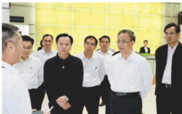
中天万城 周泽华 陈亚伟 / 文