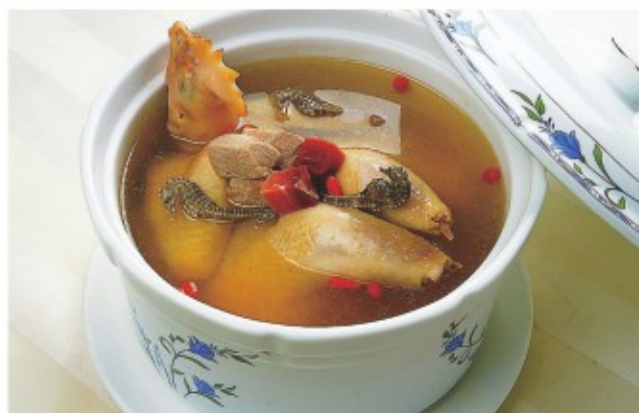
银丰清官海马鸡 (图片仅供参考)

潮湿的春天，来一锅沸腾鱼，祛湿的同时又能使爱吃辣的吃货们爽口直呼过瘾，鱼的鲜香和花椒的麻香融为一体，用花椒的麻和芝麻的香，葱段的绿，呼应春天主题，看起来春意盎然，闻起来鲜香诱人，吃起来麻辣爽口，还很下饭呢。