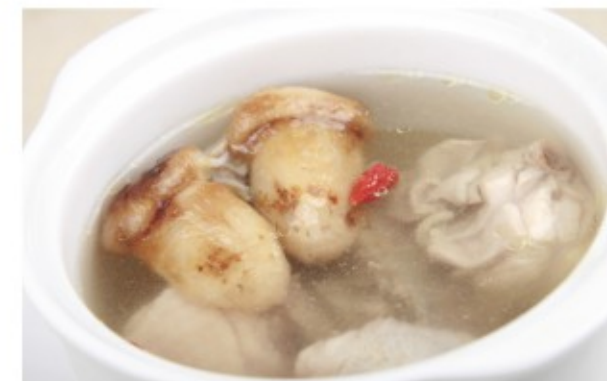
冰山雪莲松茸炖老鸡 (图片仅供参考)

春季三款靓汤：冰山雪莲松茸炖老鸡、鲜松茸花胶炖螺头汤、地虫草虫草花炖肉汁汤。均有美容养颜，清润、滋阴的功效，口感鲜甜，松茸肉质细腻，香味浓郁，别具风味，有很高的营养价值和特殊药用价值。