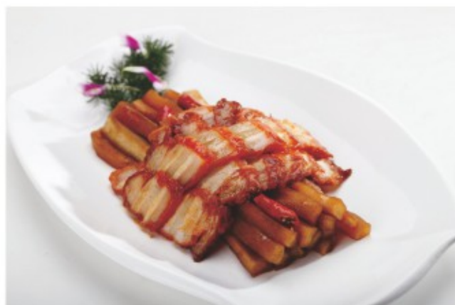
乳香肉 (图片仅供参考)

炸的香脆地乳香肉，新鲜韭黄胡萝卜丝，黄瓜片，用煎得金黄的面皮将这些全部层层包裹，香酥脆爽，自己动手，更美味有趣。