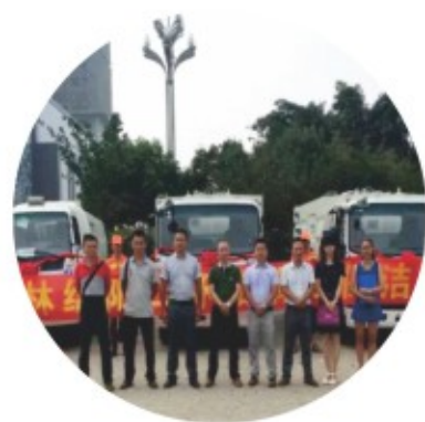
绵阳项目开工仪式

中科华宝在大力开拓业务的同时，不断提升公司项目运营管理水平并加强公司的管理理念宣导，促进企业文化建设。公司力求推陈出新，走在行业最前端，树立中科华宝独特的品牌。目前已经顺利开展了多期业务经理工作会议、项目经理的培训课程及首期行政人事&财务人员培训课程。为劳逸结合，增强团队凝聚力及合作精神，在学习理论知识的过程中，还增加了户外参观交流活动，大家一同参观了股东单位中天集团以及旗下的联科国际信息产业园和工农8号，对股东公司的资质实力有了更具体的了解。