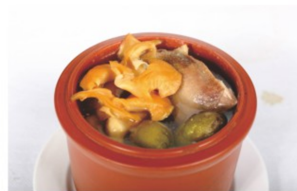
鲜松茸花胶炖螺头汤 (图片仅供参考)