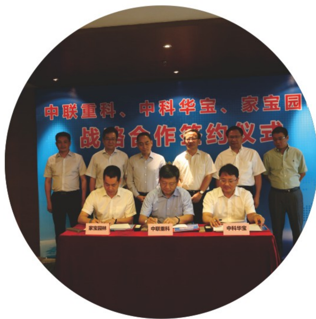
中联重科战略合作协议签约仪式