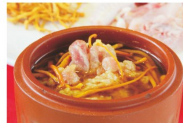
地虫草虫草花炖肉汁汤 (图片仅供参考)

更多云南菌语之系列菜式请关注我们微信公众号：silverworld_hotel或拨打我们的热线0769-22899899咨询