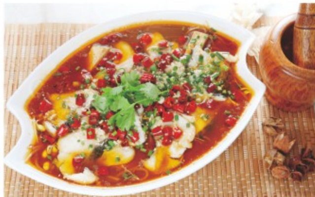
沸腾鱼 (图片仅供参考)

潮湿的春天，来一锅沸腾鱼，祛湿的同时又能使爱吃辣的吃货们爽口直呼过瘾，鱼的鲜香和花椒的麻香融为一体，用花椒的麻和芝麻的香，葱段的绿，呼应春天主题，看起来春意盎然，闻起来鲜香诱人，吃起来麻辣爽口，还很下饭呢。