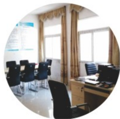
江西南昌市经开区项目办公布置