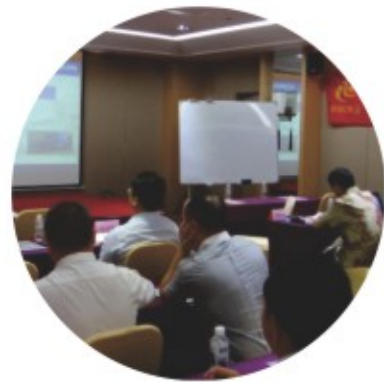
业务经理半年度工作会议