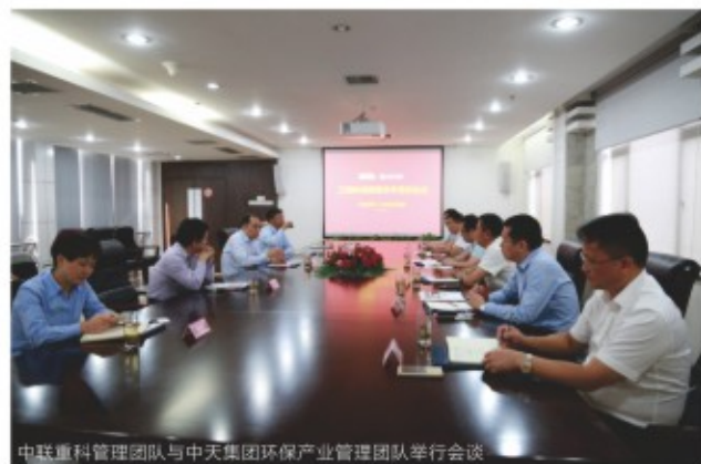
中联重科管理团队与中天集团环保产业管理团队举行会谈