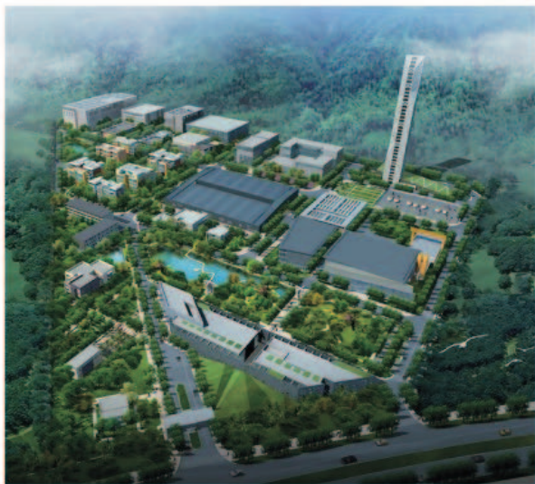
万科住宅产业化研究基地鸟瞰图

万科住宅产业基地是目前建设部已批准的9个国家住宅产业化基地中唯一的从事产业化技术研发的基地，是万科集团住宅产业化技术及产品的研发、培训平台，并与10多家国内外知名机构签订战略合作协议，共同推进住宅产业化工作，形成产业技术和产品研发的集群效应，将基地打造成中国PC住宅产业技术的硅谷。