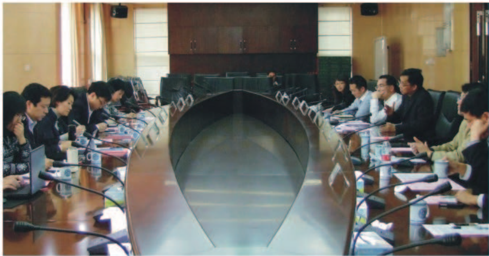
考察团与南城区主要领导、市科技局有关领导会谈

年初，中关村科技园区海淀园管委会考察团到东莞松山湖和南城区开展了为期两天的调研活动。考察团的此次调研主要了解东莞在推动区域经济发展及产业转型升级方式转型的经验做法和政策措施，促进海淀园的科技成果转化和产业升级。据悉，中关村科技园区海淀园的前身是全国第一个国家级高新技术产业开发区——北京市新技术产业开发试验区，是中关村科技园区的发祥地、中关村一区十六园之首、中关村国家自主创新示范区的核心区，拥有孵化器35家、加速器4家、大学科技园15家、12个专业园区和11个产业集聚区。虽然海淀园的科技发展位于全国前列，但也同样面临着产业升级的难题。而东莞是闻名世界的制造业基地，在推动产业结构转型升级的课题上取得了显著的成绩。