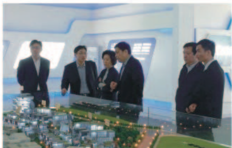
考察团参观联科国际信息产业园